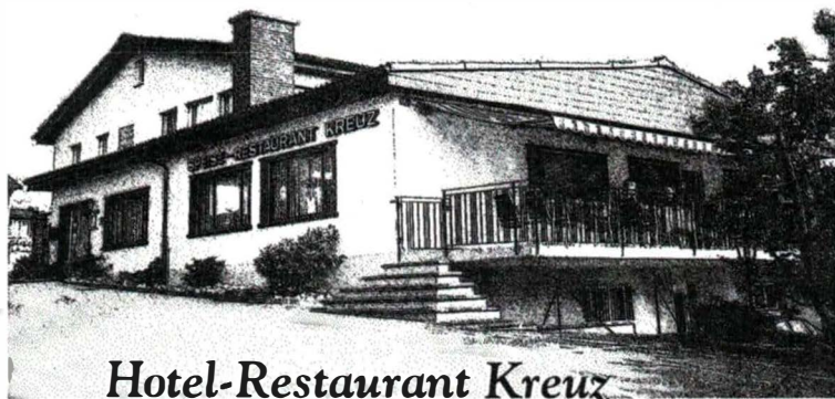
Hotel-Restaurant Kreuz Inwil/LU