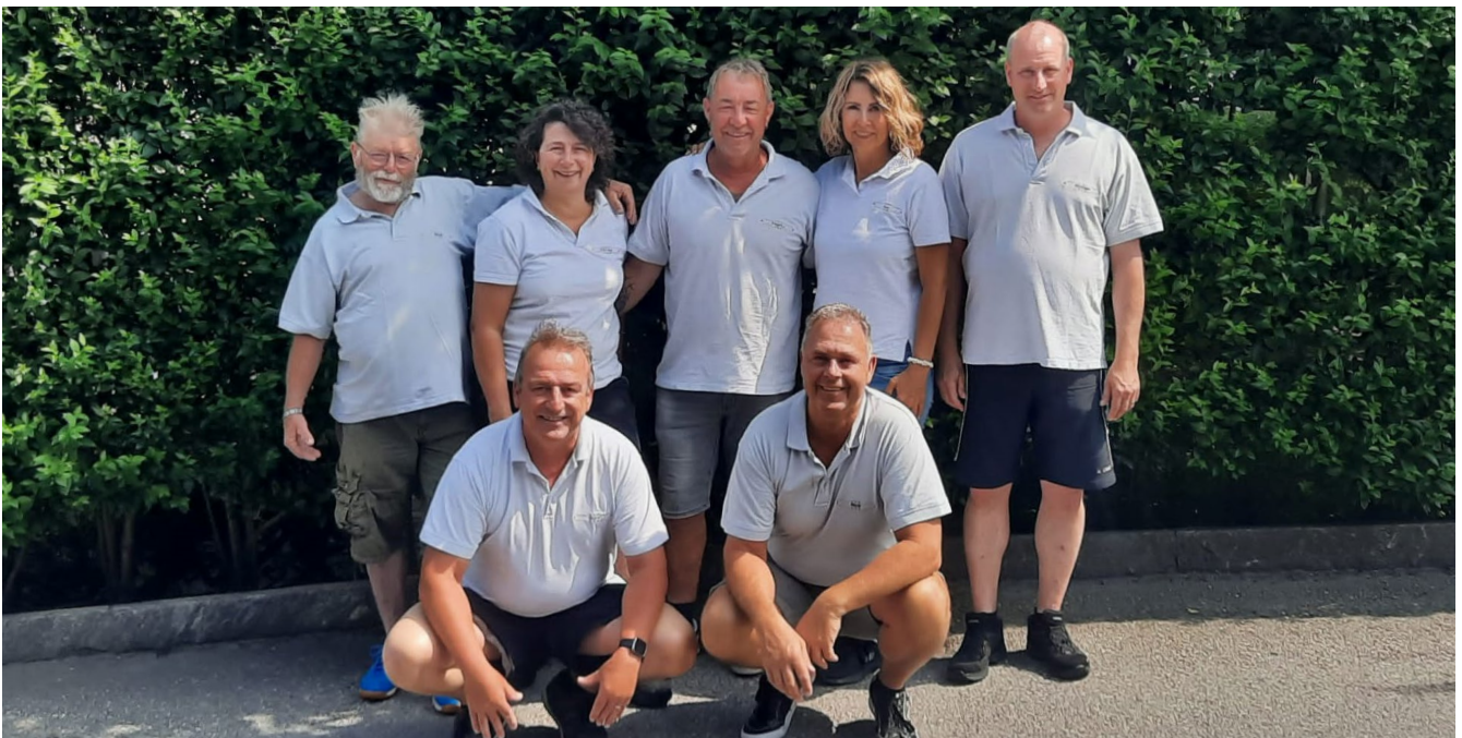
Der KK Alpenglöggli aus dem UV Entlebuch ist im schweizer Klubcup 2023 eine Runde weiter.