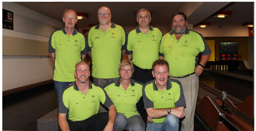
Abgebildete Kegelklubs - oben: KK Alpenglöggli 84 | unten: KK Siesta